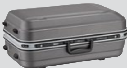
Torbica za objektiv CT-505 (priložena)