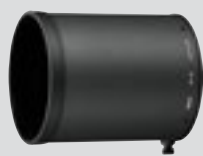
Sončna zaslonka HK-34 (priložena)