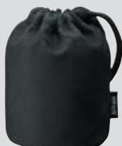
Torbica za objektiv CL-1015 (priložena)